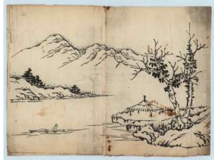
<나전칠 산수문 액자>도안, 김봉룡 작