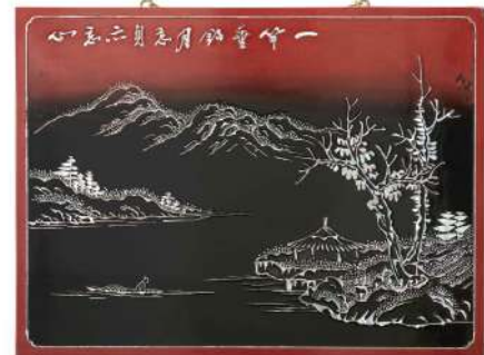
나전칠 산수문 액자, 김봉룡 작